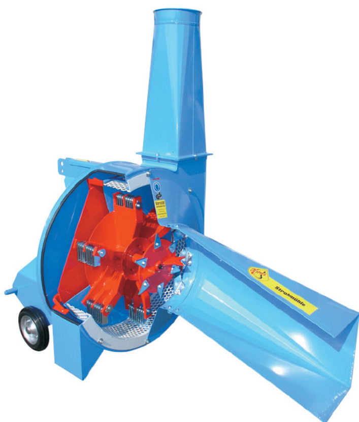
Doorsnede stromolen STZ/STM

De stromolens worden standaard compleet draaiklaar afgeleverd met één zeef naar keuze, één bocht 90°, één lengte buis dia 250 mm en de benodigde spanringen. Op alle nieuwe stromolens zit één jaar volledige garantie en het tweede jaar op onderdelen (geen garantie op slijtage van onderdelen, zoals slagmessen).