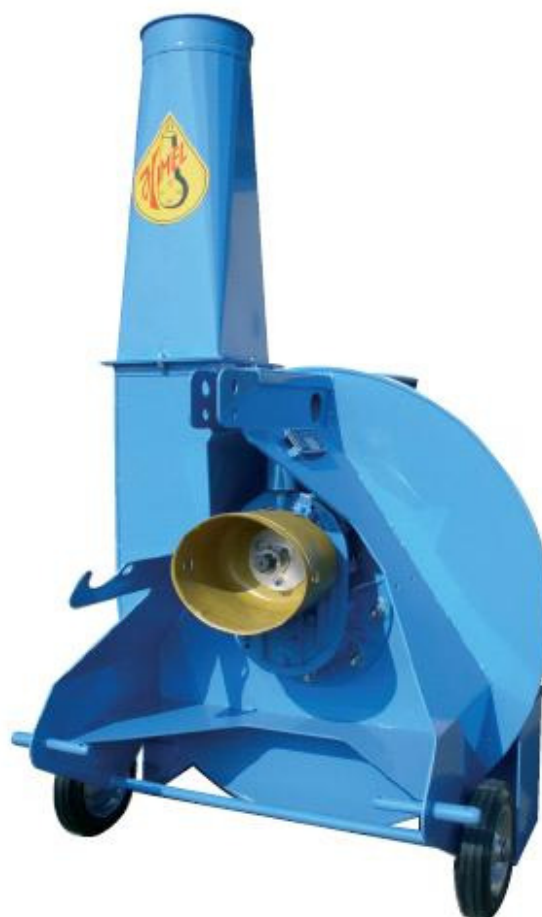
Stromolen op aftakas in driepuntsophanging

Maakt alle soorten stro, riet en grof natuurhooi met zeefmaten van 7 mm. tot 70 mm.