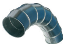
Bocht 15°-90° Ø 250 mm.