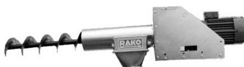
Aandrijfunit met directe aandrijving