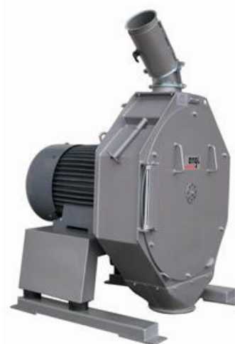
Hamermolen Engl type SM-120