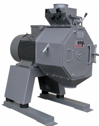
Hamermolen Engl type SM-90