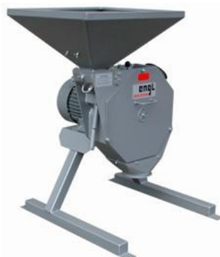
Hamermolen Engl type SM-30

Voor hulpstukken als pijpen, bochten, cyclonen, magneten, aanzuigstukken en kleppenkasten enz. enz. hebben wij een aparte prijslijst. Elke molen kan worden ingepast in een elektronisch bestuurbare maal-menginstallatie.